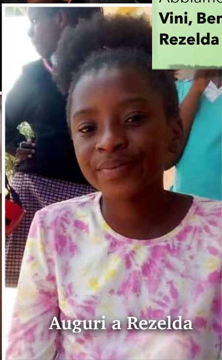
Auguri a Rezelda