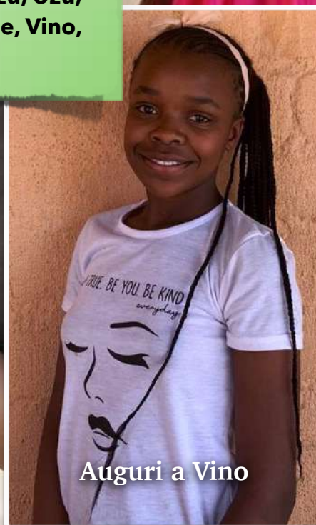
Auguri a Vino