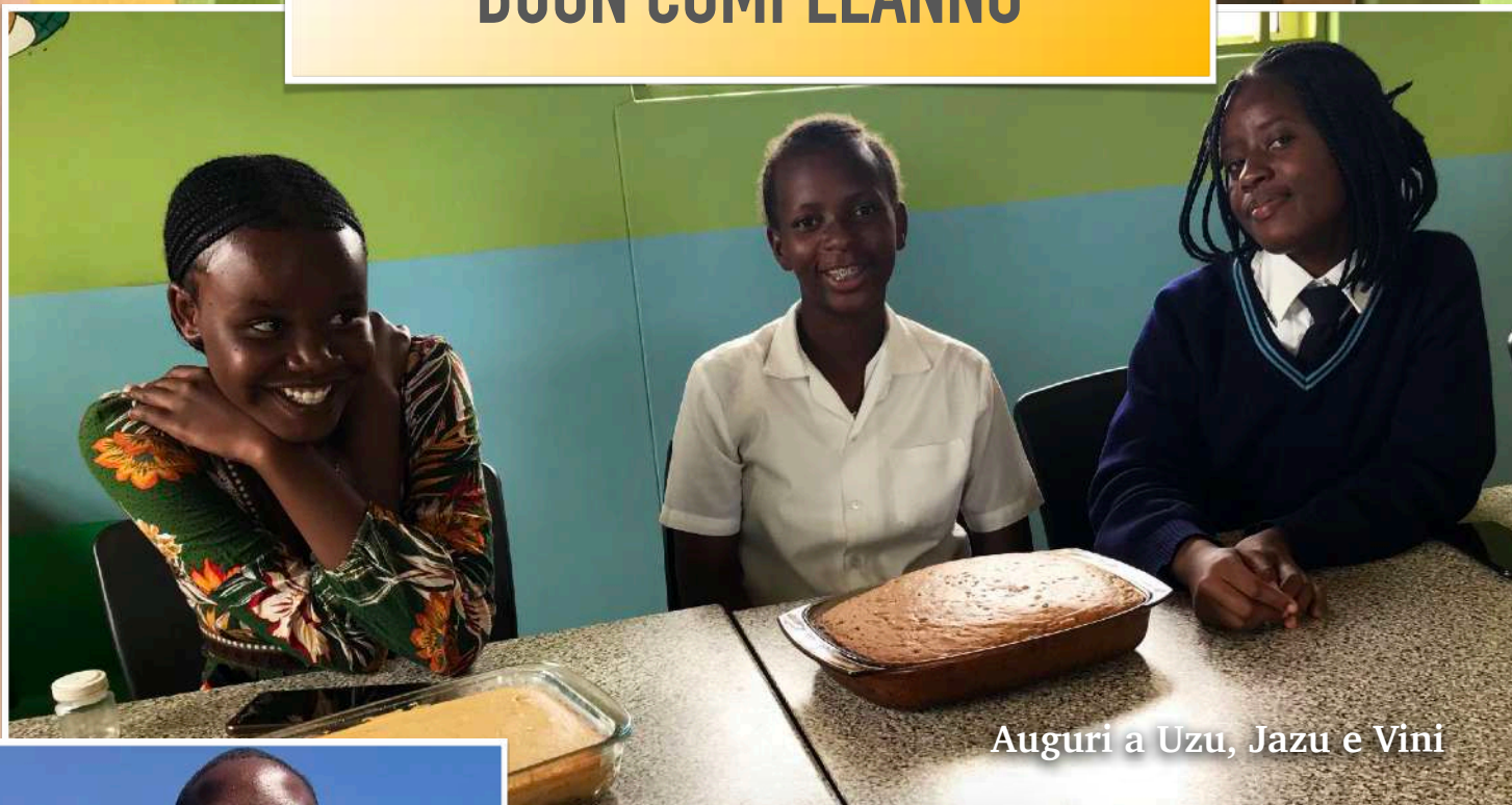
Auguri a Uzu, Jazu e Vini